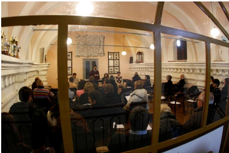
La presentazione nella sala soppalcata dell’Oratorio di Villacampagna