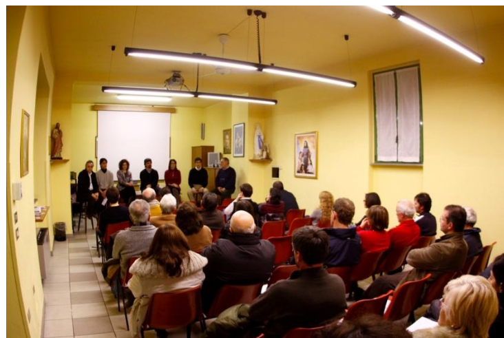
La serata a Gallignano presso l’Oratorio

Il metodo che si intende sin da ora adottare è quello delle politiche partecipative e pertanto sono stati istituiti dei gruppi di lavoro su ambiti specifici per studiare lo stato attuale e per proporre soluzioni .