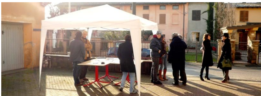
Incontro a Isengo con gazebo nel cortile della Casa Parrocchiale

Durante le presentazioni pubbliche i relatori hanno invitato il pubblico ad aderire e dare il proprio contributo nei diversi ambiti, nelle serate stesse sono state raccolte le prime adesioni, chiunque altro volesse aggiungersi è libero di farlo. Più siamo più questo progetto avrà futuro.