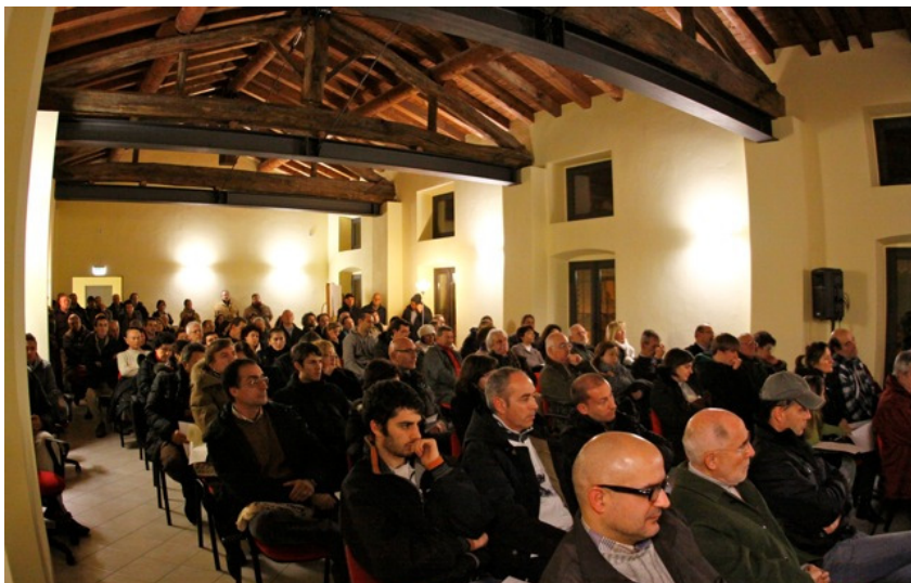
Il numeroso pubblico intervenuto nella Sala Conferenze della Ex-Filanda Meroni

Documento condiviso emerso giovedì 17 dicembre